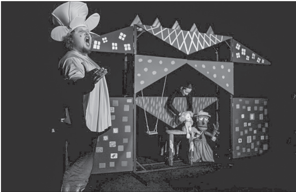
Na „Królową Śniegu” rodzice mogą zabrać z powrotem już trzyletnie dzieci.