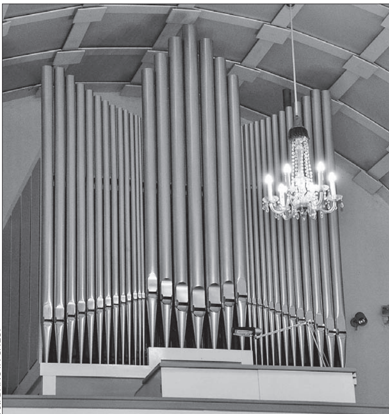
Wyremontowane organy w kościele ewangelickim w Suchej Średniej.