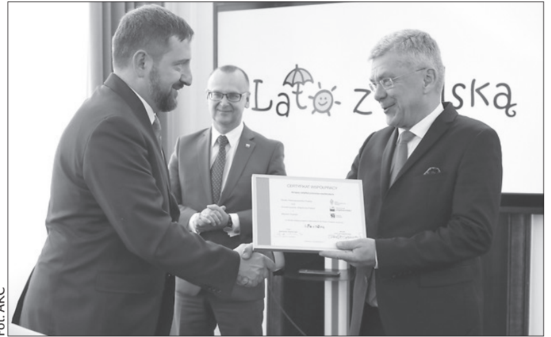
Akcja „Lato z Polską” odbywa się od 2009 roku.

Karczewski wyznał, że ogromne wrażenie wywarł na nim entuzjazm dzieci i młodzieży, które spędziły wakacje w Polsce. – Wiem, że z radością tutaj przyjechali, ponieważ odwiedziłem wiele miejsc, w których odbywały się obozy i kolonie. Prawie wszyscy uczestnicy, z którymi rozmawiałem, mówili po polsku – powiedział marszałek Karczewski. Podkreślił, że wakacje spędzone w Polsce były dla nich okazją do doskonalenia języka polskiego, a możliwość rozmawiania z rówieśnikami