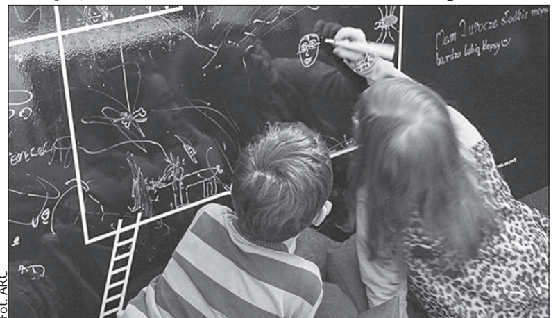
Podczas oglądania cieszyńskiej wystawy najmłodszy się nie nudzą.

Wiemy, że czytanie dzieciom jest ważne, ale czy mamy świadomość, że towarzyszący tekstowi obraz ma również wielką siłę? Albo że ilustrator jest twórcą równorzędnym z autorem tekstu? Przekonuje o tym najnowsza wystawa przygotowana przez Zamek Cieszyn.