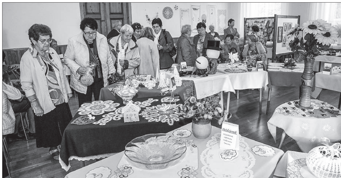
Wystawa „Pod dyktando kalendarza” została zorganizowana z okazji 70-lecia PZKO.