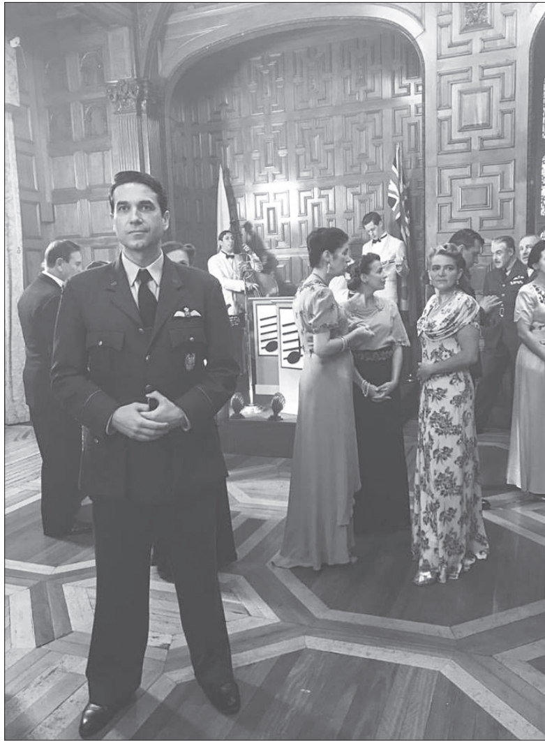
Marcin Dorociński na planie filmowym.

Z kolei Milo Gibson, syn Mela Gibsona, zagra Kanadyjczyka Johna A. Kenta, który jako dowódca „polskiego” Dywizjonu 303 był często nazywany „Kentskim”. On rów-