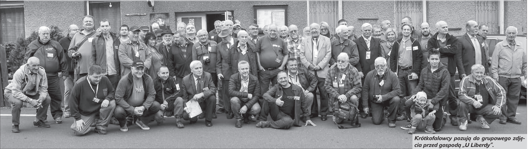
Krótkofalowcy pozują do grupowego zdjęcia przed gospodą „U Liberty”.

W sobotę w gospodzie „U Liberty” w Tyrze odbyło się 24. Międzynarodowe Spotkanie Krótkofalowców. Pod Jaworowoy zjechali pasjonaci i pasjonatki z Polski, Czech, Słowacji i Austrii.