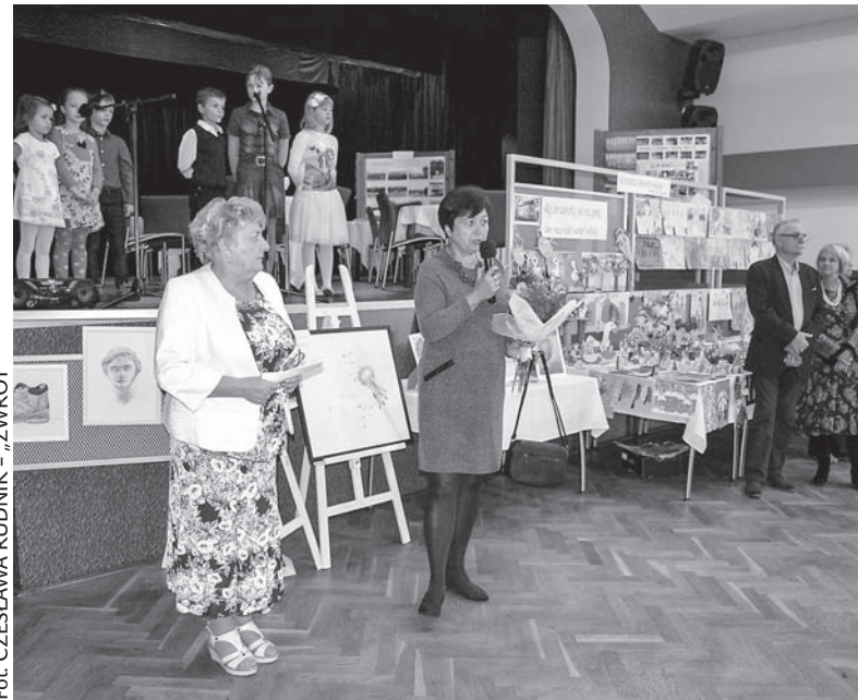
Wernisaz wystawy w Stonawie.

– Przyjechały panie z klubów kobiet PZKO z całego Zaolzia, od Bukowca po Bogumin, były przedstawicielki Sekcji Kobiet przy ZG