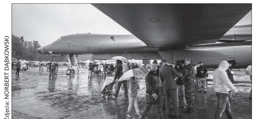
Amerykański bombowiec chronił przed deszczem doprawdy... bombowo.