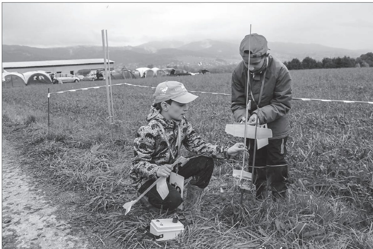
W milikowskich zawodach wystartowało wielu młodych modelarzy.