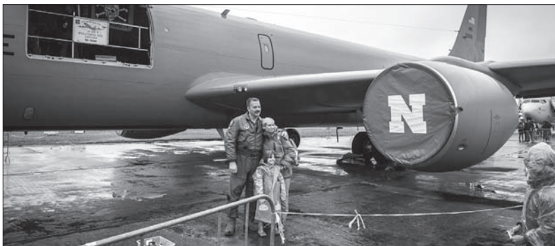
Przy niemal każdym stanowisku można było sobie zrobić pamiątkowe zdjęcie, jak tu przy amerykańskim bombowcu.