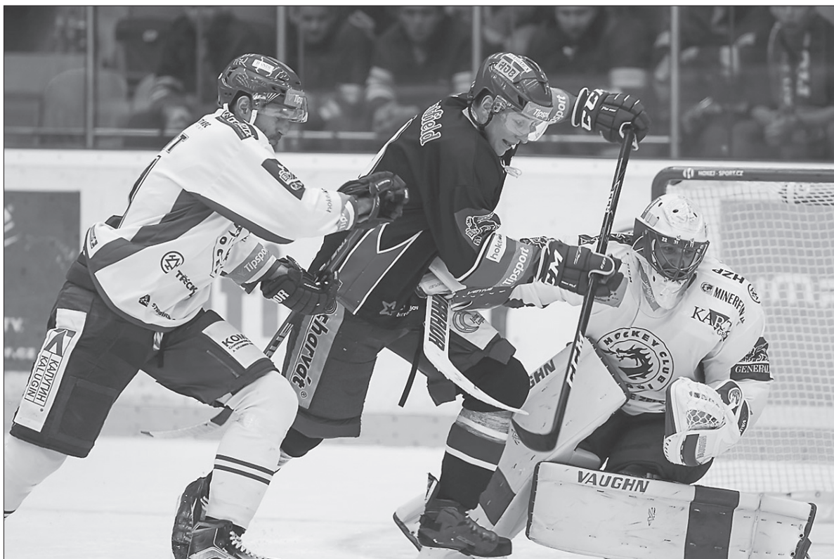
Stalownicy przegrali w Hradcu Kralowej 1:3. Hokejowa karuzela mknie jednak dalej.