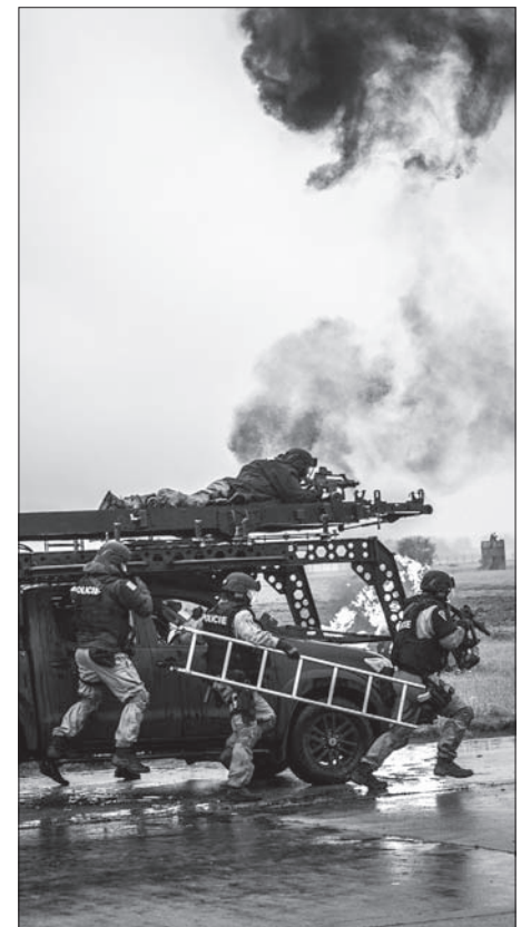
Akcja uwalniania zakładników.