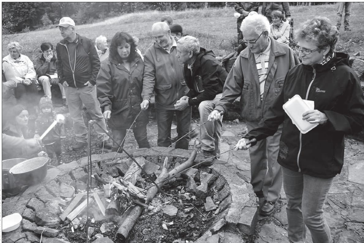
Ognisko członków PZKO na Goduli ma już kilkunastoletnią tradycję.

– Goduła to góra kultowa, owiana wieloma tajemnicami. W przeszłości, jeszcze w czasach pogańskich na