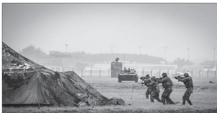
Zdobywanie fortu przez wojsko.