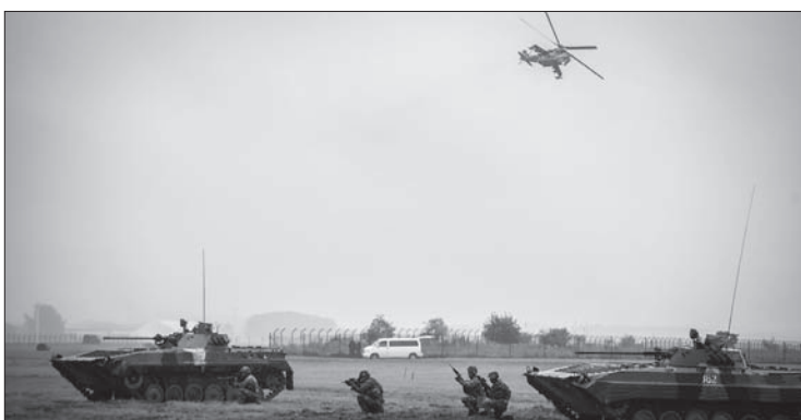
Atak na pozycję wroga z udziałem czołgów.