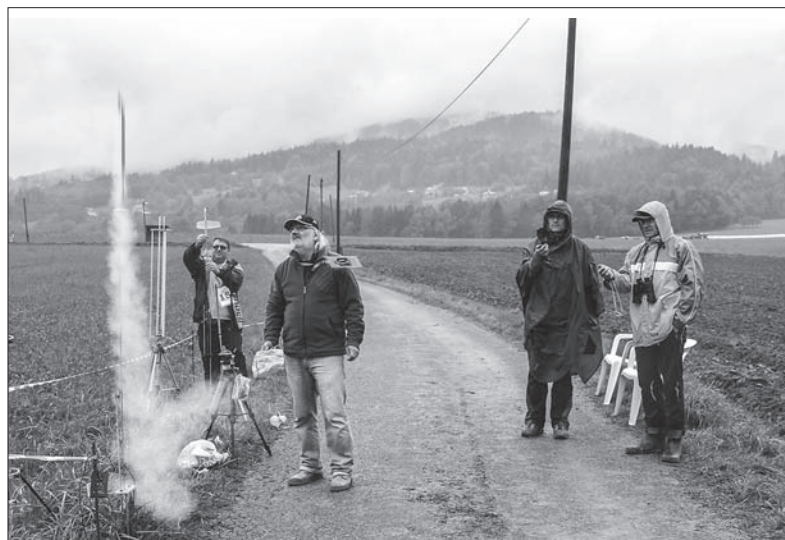
Modelarstwo raketowe wymaga praktyki i sporej wiedzy.

i obserwuję, że młodzieńcza pasja przenosi się później na płaszczyznę zawodową. Moi modelarze trafiają bowiem do lotnictwa albo pracują w przemyśle wysokich technologii. Nasi modelarze startują również w prestiżowych zawodach w USA, a na tym poziomie wykorzystywane są już kosmiczne technologie – mówił Kasprzycki.