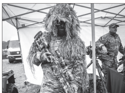
Rozmawiając ze snajperem z Jednostki Wojskowej AGAT można było się dowiedzieć o wielu aspektach pracy strzelca wyborowego.