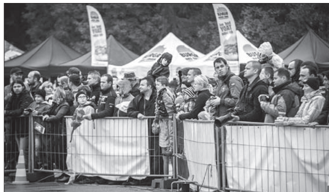
Mimo deszczu publiczność dopisała.