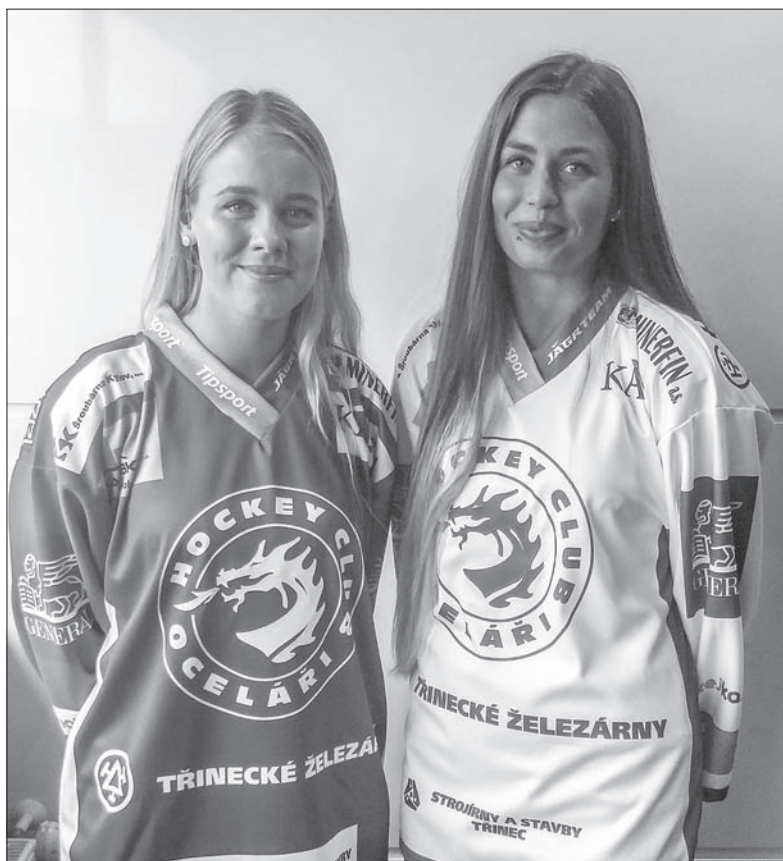
Ładne te nowe dresy, nieprawdaż?