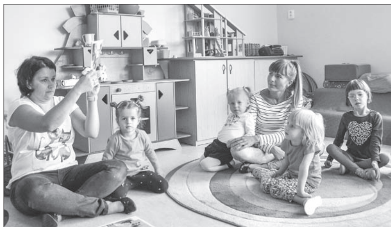
Polskie przedszkole w Lutyni Dolnej od poniedziałku pracuje w nowych pomieszczeniach, które zostały zaadaptowane specjalnie dla jego potrzeb w budynku polskiej podstawówki. Wcześniej przedszkole mieściło się w osobnym budynku. (sch)