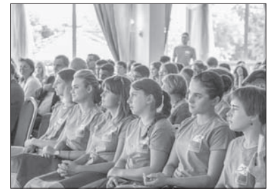
Młodzież podczas uroczystej akademii.

W czasie zlotu odbyła się także dyskusja panelowa dotycząca aktualnych