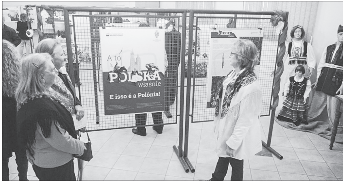
Wernisaż dostarczył uczestnikom wielu wzruszeń.

Od 24 lipca do 18 sierpnia 2017 roku w Veranópolis została zaprezentowana wystawa multimedialna „A to Polska właśnie - E isso é a Polónia” przygotowana przez Stowarzyszenie „Wspólnota Polska” we współpracy z Centralną Reprezentacją Wspólnoty Brazylijsko-Polskiej „BRASPOL” stanu Rio Grande do Sul.