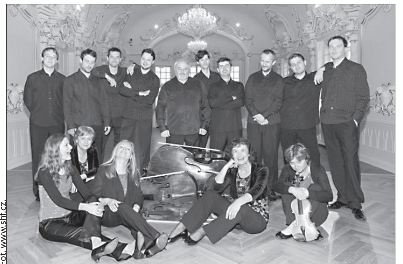
Słowacka Orkiestra Kameralna Bohdana Warchala zagra w Jabłonkowie i Olbrachcicach.

W najbliższym poniedziałek (11 bm.) odbędzie się koncert w kościele ewangelickim w Bystrzycy. Wykonawcy przyjadą z Polski. Orkiestra