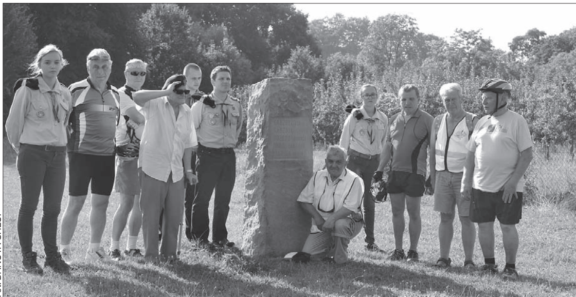
Rajdy po żywocickich stelach odbywają się systematycznie od kilku lat.