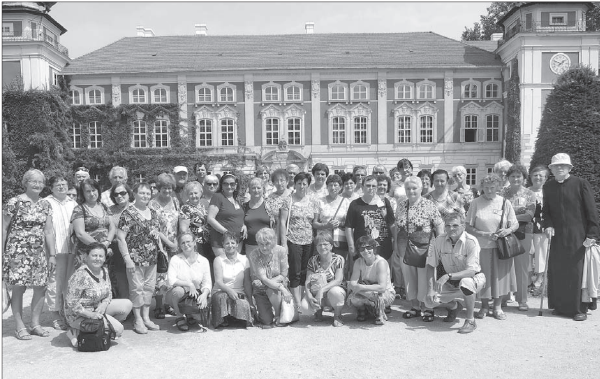
Pielgrzymi przed pałacem w Łańcutu.

Z Łańcuta pielgrzymi udali się do Przemysła, najstarszego miasta na wschodzie Polski. W przemyskiej archikatedrze z XVI wieku Cieszynianie mieli własną mszę