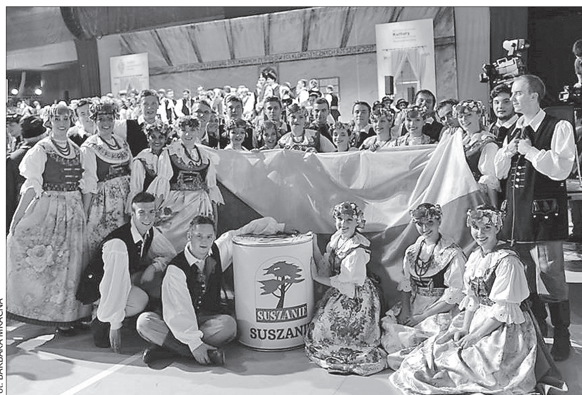
Zespoły Pieśni i Tańca „Suszanie” z Suchoj Górnjej i „Olza” z Czeskiego Cieszyna wzięły w tym tygodniu udział w XVII Światowym Festiwalu Polonijnych Zespołów Folklorystycznych w Rzeszowie. Na zdjęciu „Suszanie” po Koncercie Galowym, który odbył się we wtorek w hali widowiskowej. Festiwal zakończył się wczoraj. Wkrótce zamieścimy bardziej obszerną relację. (dc)