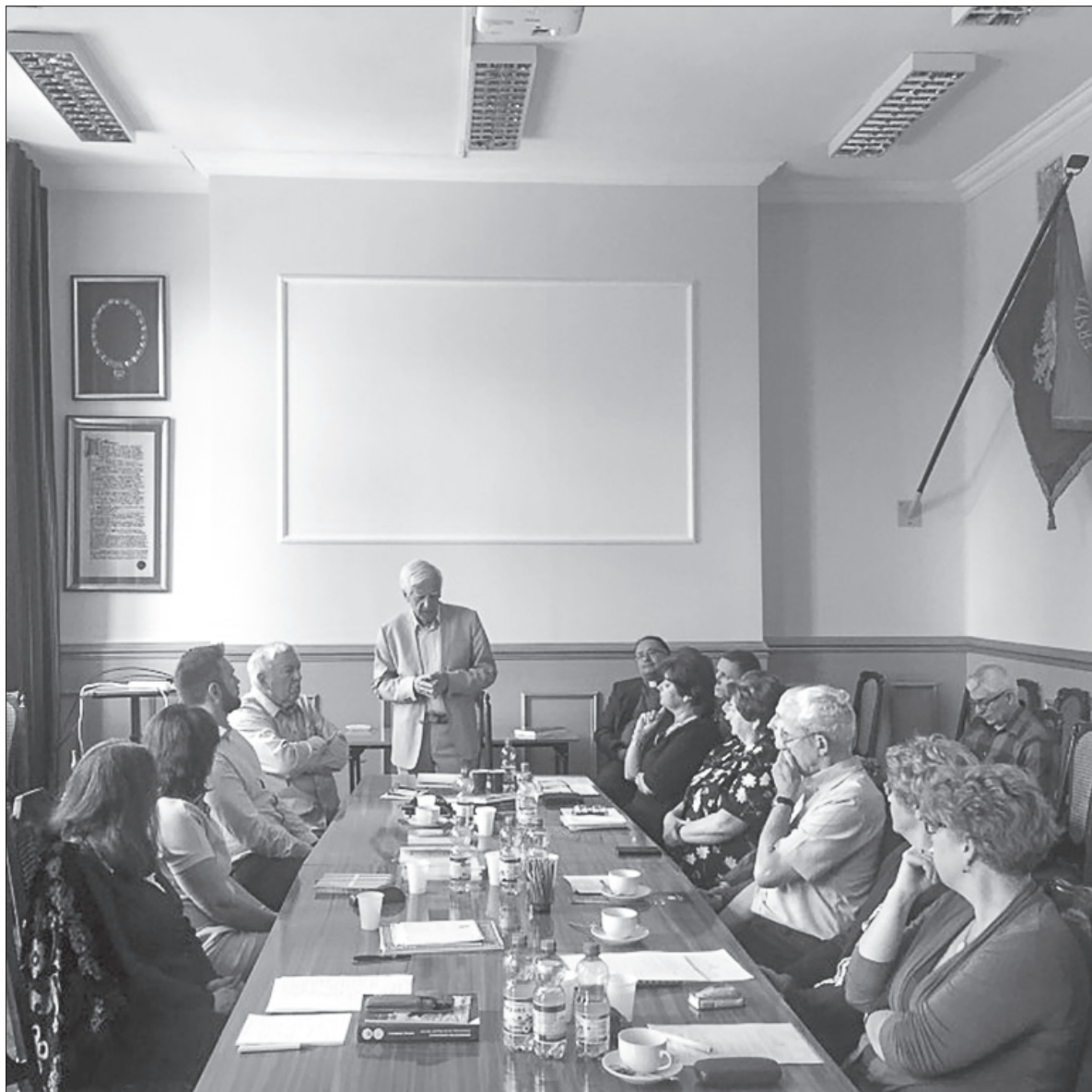
Konferencja i jubileusz Komisji ds. Stosunków Polsko-Czeskich i Polsko-Słowackich na Uniwersytecie Śląskim w Cieszynie.

Interdyscyplinarny profil naukowy komisji sprawił, że na posiedzeniu w dniu 29 listopada 1995 roku powołano dziewięć specjalistycznych sekcji: literaturoznawczą, językoznawczą, historyczną, etnologiczno-socjologiczną, muzyczną, sztuk pięknych, teologiczną, pedagogiczną i ekologiczną. Sekcje te okazały się jednak tworam mało stabilnymi i pod koniec lat dziewięćdziesiątych uległy rozwiązaniu. Trwałe okazały się natomiast problemy badawcze, wokół których ogniskować się miały prace komisji. Świadczą o tym wynikające z jej działalności regulaminowej zebrania naukowe i posiedzenia oraz organizowane bądź współorganizowane przez komisję konferencje naukowe i sympozja, także przedsięwzięcia o charakterze