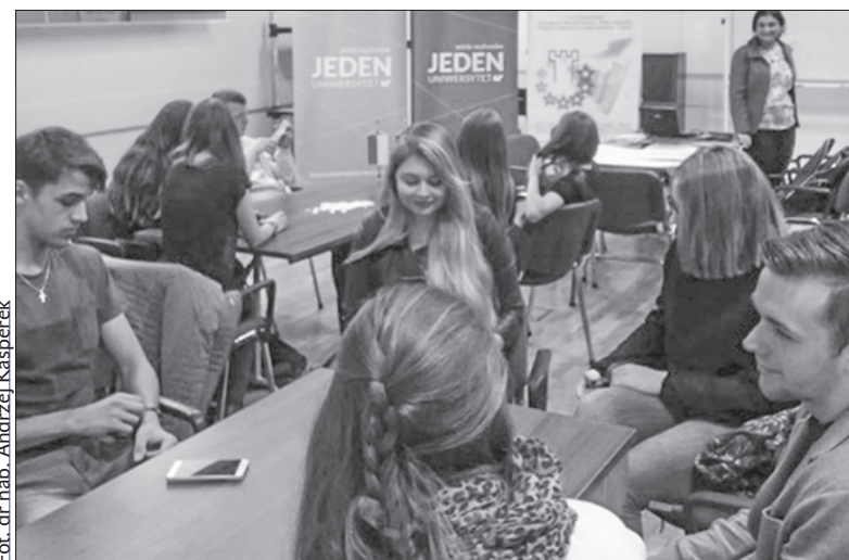
Pierwsze warsztaty w kwietniu w ramach Polsko-Czeskiej Wolnej Szkoły.