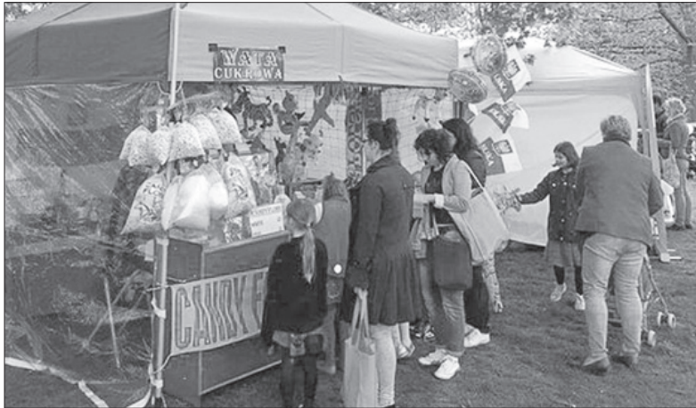
Wata cukrowa to jeden z najbardziej ulubionych przez dzieci elementów polskich pikników.

W Edynburgu chętni mogli wziąć udział w organizowanej przez lokalny oddział ZHP grze miejskiej „w poszukiwaniu białoczerwonych”, która miała przybliżyć jej uczestnikom polską historię. Z kolei w miejscowości Ingham w East Midlands odbył się dzień otwarty w dawnej bazie brytyjskiego lotnictwa, gdzie w