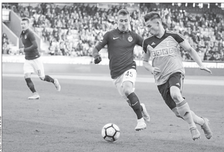
W listopadzie w Pradze ze zwycięstwa 3:0 radowała się Sparta.