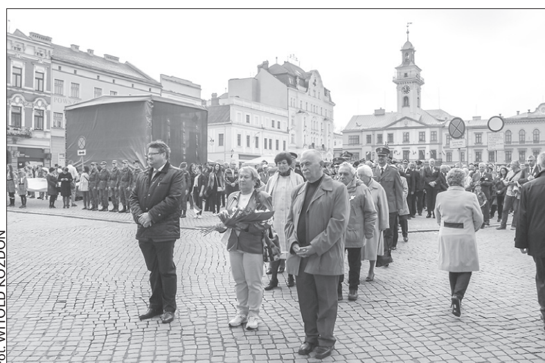
Polacy z Zaolzia wzięli wczoraj udział w manifestacji na cieszyńskim rynku z okazji Święta Konstytucji 3 Maja. Nie zabrakło przedstawicieli Kongresu Polaków w RC, ZG PZKO oraz innych zaolziańskich organizacji. Więcej na str. 2.