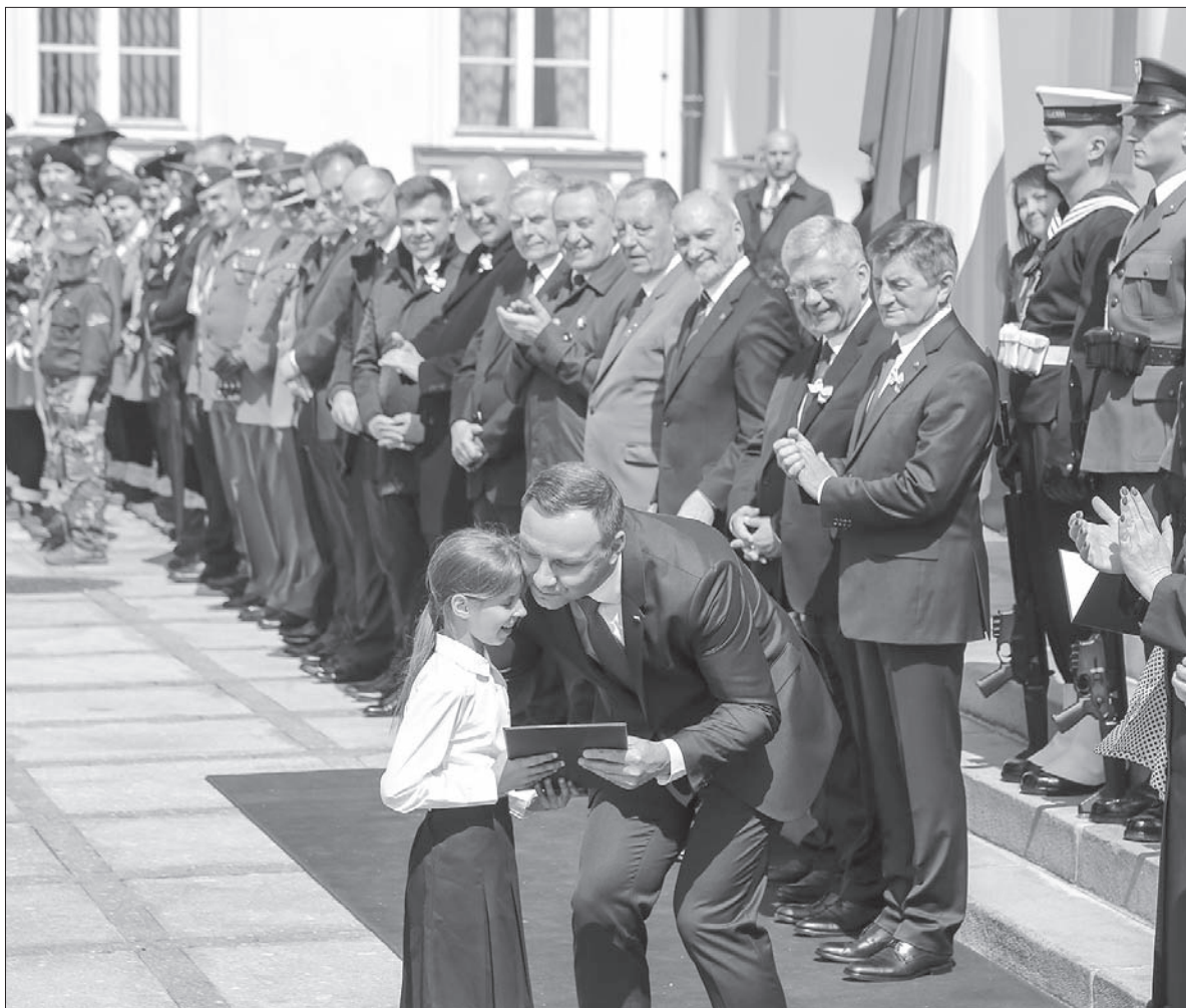
Jednym z elementów wtorkowej uroczystości było wręczenie legitymacji dla uczniów.