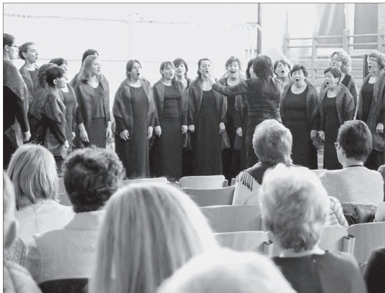
Chór Żeński „Melodia”.

– Pierwsze miejsce zdobył Chór Żeński Uniwersytetu Łódzkiego. My zajęliśmy drugie miejsce i jest to dla nas bardzo cenna nagroda, ponieważ nie spodziewaliśmy się, że poziom tegorocznego konkursu będzie tak wysoki. Dodatkowo typowo amatorskiemu chórowi trudno mierzyć się z profesjonalnymi zespołami, tymczasem okazało się,