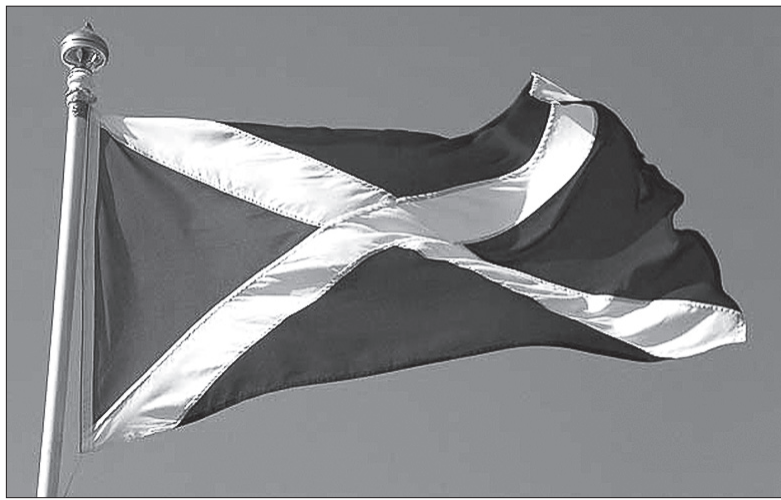
W Szkocji mieszka około 90 tys. Polaków. Są bardzo ceni.

Szkocki rząd nie dostał takiej informacji, podobnie jak Polacy. Ludzie z Polski i innych krajów pytają mnie o to bardzo często. Pytają na przykład, czy powinni składać wnioski o brytyjskie obywatelstwo, czy otrzymają zgodę na dalsze życie w Wielkiej Brytanii. Mamy wielką nadzieję, że będą mogli zostać, ale czekamy od miesięcy na odpowiedź na te pytania. Wiele polskich rodzin przychodzi do nas i mówi o tym, jak dużo trud-