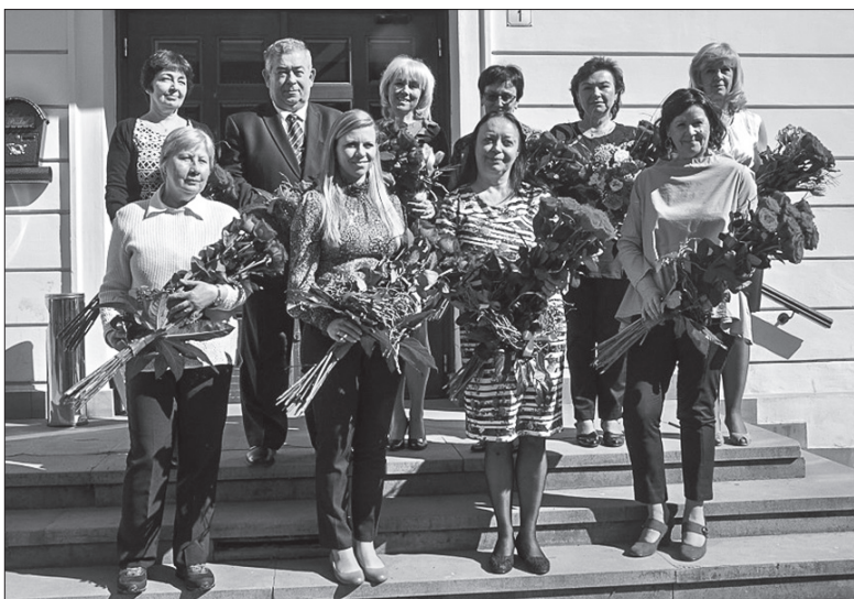
Podczas uroczystości nie zabrakło pamiątkowego zdjęcia.

Sama nagrodzona nie kryła zaś radości. – Ja bardzo lubię to, co robię. Praca z młodzieżą i dziećmi od zawsze była moim życiowym spełnieniem – mówiła nauczycielka, która zanim podjęła pracę w czeskie-