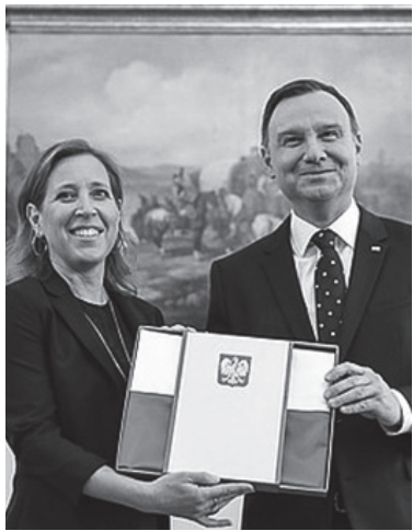
Prezydent RP Andrzej Duda wręczył Susan Wojcicki biało-czerwoną flagę.

Susan Wojcicki urodziła się w 1968 roku w Stanach Zjednoczonych. Z wykształcenia jest ekonomistką. Z wyróżnieniem ukończyła Uniwersytet Harvardzki i przez wiele lat była wiceszefową Google. Od 2014 roku jest prezesem