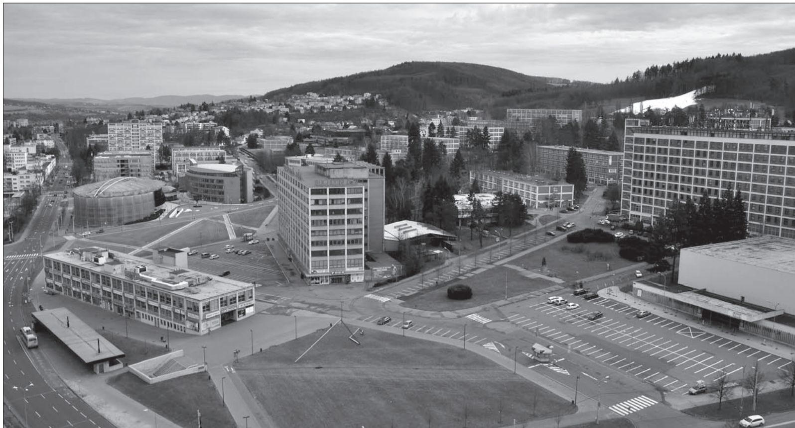
Z wieżowca Tomáša Baty roztacza się piękny widok na miasto modernizmu.

Prosto z budynków uniwersyteckich przeszliśmy do pobliskich dawnych zakładów obuwniczych Tomáša Baty, zbudowanych z charakterystycznej czerwonej cegły, nad którymi góruje wieżowiec z 1938 roku, który w chwili otwarcia był drugim najwyższym budynkiem w Europie i najwyższym w Czechosłowacji. Ewenementem na skalę światową jest zainstalowana tam jedna z wind (nadal działająca), mieszcząca mo-