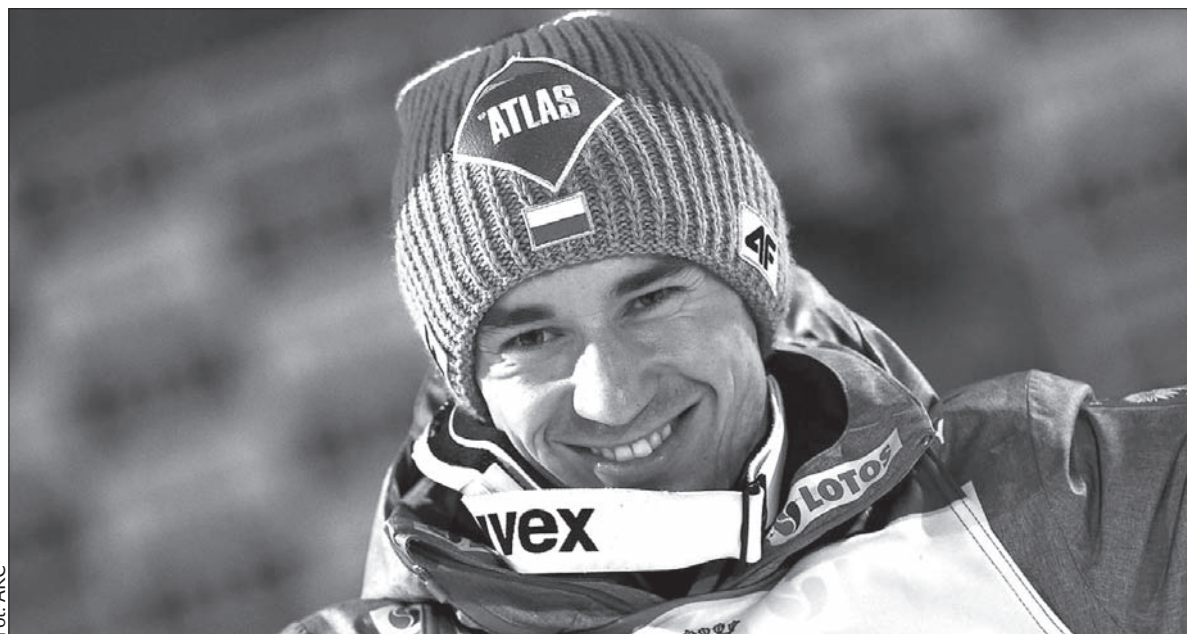
Do medalowych pewniaków w polskiej ekipie należy skoczek Kamil Stoch.

– Wyjazd do Lahti traktujemy tak, jak na każde inne zawody. Nie myślimy o mistrzostwach świata, jak o czymś wyjątkowym. Wszyscy znamy swoją wartość i wiemy na co nas stać – podkreślił Stoch. Pierwsza rywalizacja o medale na skoczni rozpoczyna się w sobotę. Na pierwszy ogień zawodnicy wystartują na średnim obiekcie. W czwartek 2 marca Kamil Stoch i spółka powalczą z kolei na dużym obiekcie, w sobotę 4 marca w drużynówce.