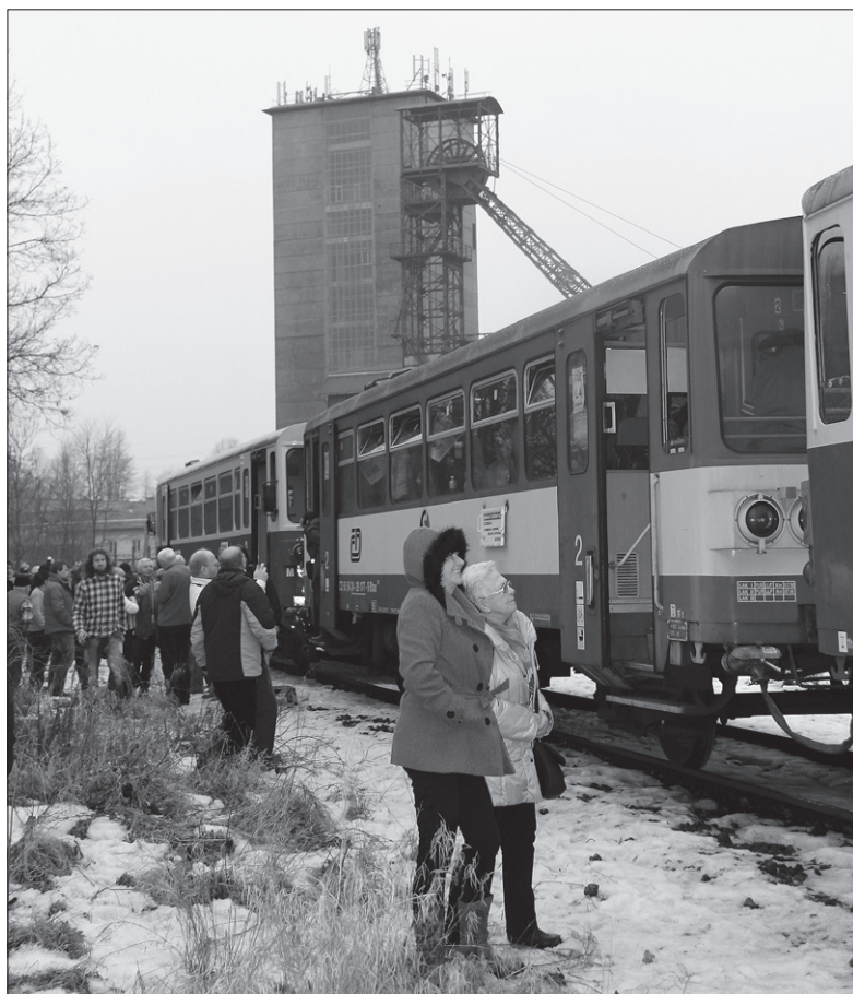
Przystanek przed szybem „Zofia”.