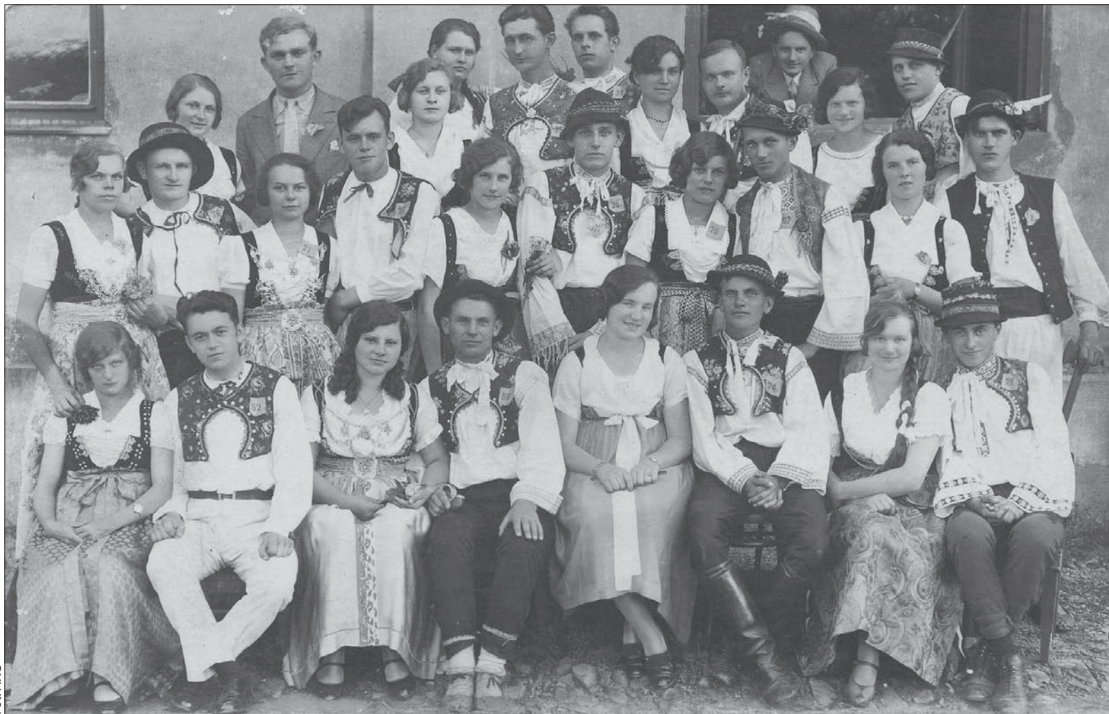
Ląki, Chór Mieszany Macierzy Szkolnej na dożynkach, rok. 1931.