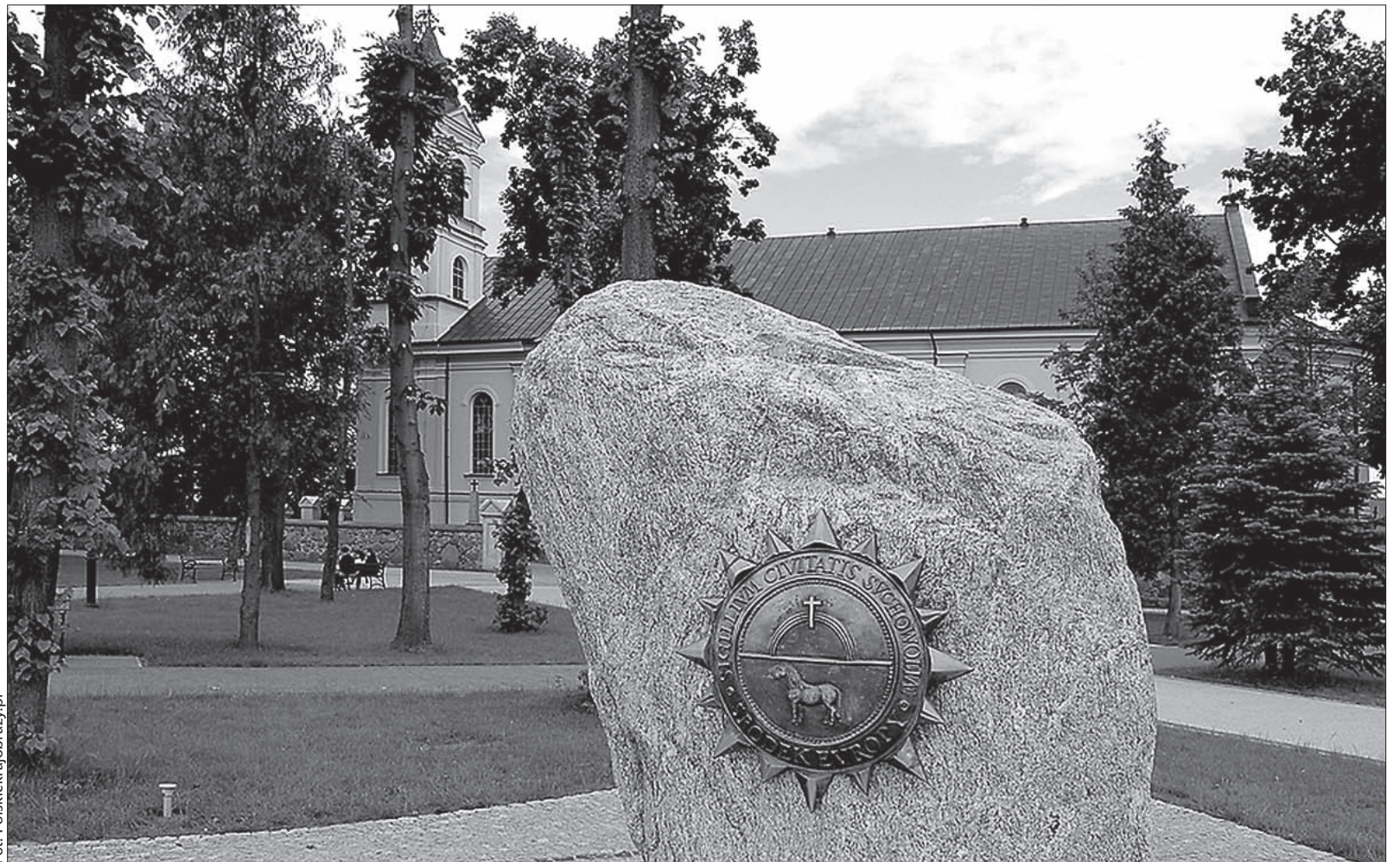
„Pierwszy” środek Europy w Suchowoli.

naukowcom wytyczenie wschodniej granicy kontynentu. Bo konia z rzędem temu, kto wie, gdzie zaczyna się Azja, a gdzie kończy Europa? W Encyklopedii Powszechnej PWN czytamy, że granicę Europy prowadzi się wzdłuż wschodniego podnóża Uralu, Embą oraz obniżeniem