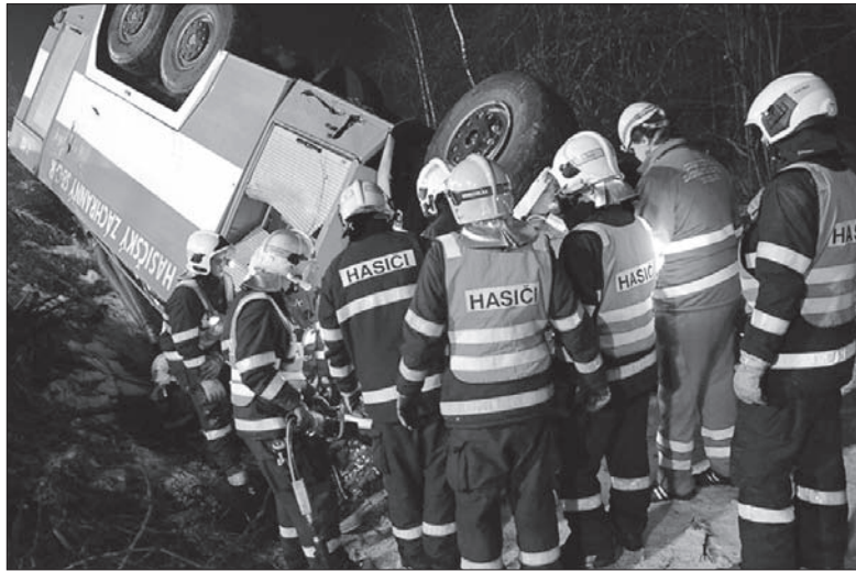
W cysternie, która wylądowała na dachu, poniósł śmierć młody strażak ochotnik.

Z 22-letnim kierowcą, którego po wyciągnięciu z kabiny natychmiast przewieziono do ostrawskiego szpitala, udało im się nawiązać